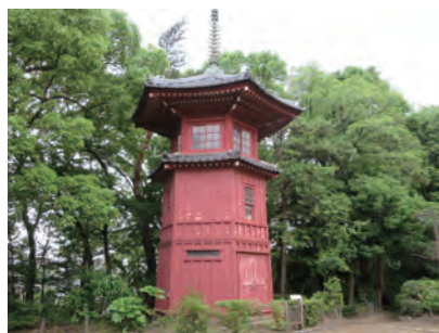
中野区立哲学堂公園 六賢台

ゴールデンウィークの連休や 10 月の週末、他の月の第一日曜日には、古建築物の内部を観覧でき、ガイドツアーも実施されています。古建築物の一つで講堂として建てられた宇宙館では、公園の歴史や創設者井上円了の生涯を辿る 20 分ほどのビデオを視聴できます。