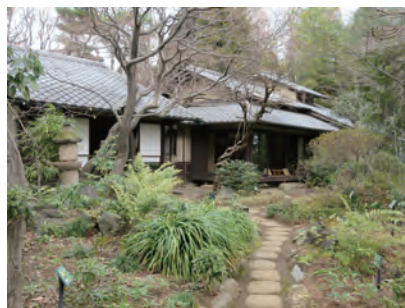
新宿区立林芙美子記念館 前庭